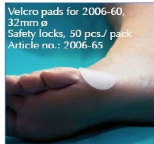
Velcro pads for 2006-60, 32mm ø Safety locks, 50 pcs./ pack Article no.: 2006-65

Plasser benløfteren ved operasjonsbordet med de lengste ben under OP bordet. Løft ved hjelp av benløfterens håndkontroll til ønsket nivå og lås bakre hjul for å sikre plassering. Bandet kan muligens trenge en ekstra forsikring ved med velcro rondeller (artikkelnr: 2006-65 ), slik at denne ikke glir av foten.